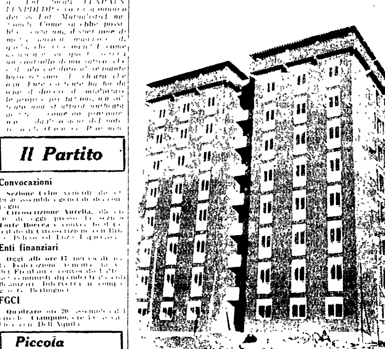
La « città deserta » di Acilia

Manca una strada e non si può costruire la stazione ferroviaria — Sedici chilometri che diventano venti